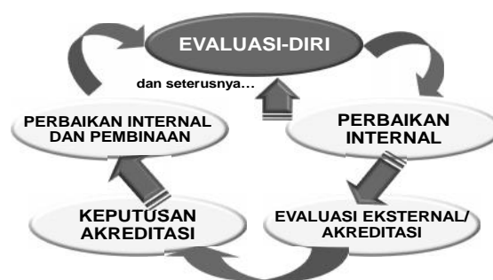
Bagan 1. Daur Penjaminan Mutu dalam Rangka Akreditasi

Seperti dikemukakan terdahulu, evaluasi-diri merupakan salah satu aspek penting dalam keseluruhan daur akreditasi dengan berbagai peran dan kegunaannya, termasuk penjaminan mutu ( quality assurance ). Keseluruhan daur penjaminan mutu dalam rangka akreditasi program studi/ perguruan tinggi itu dilukiskan dalam Bagan 1.